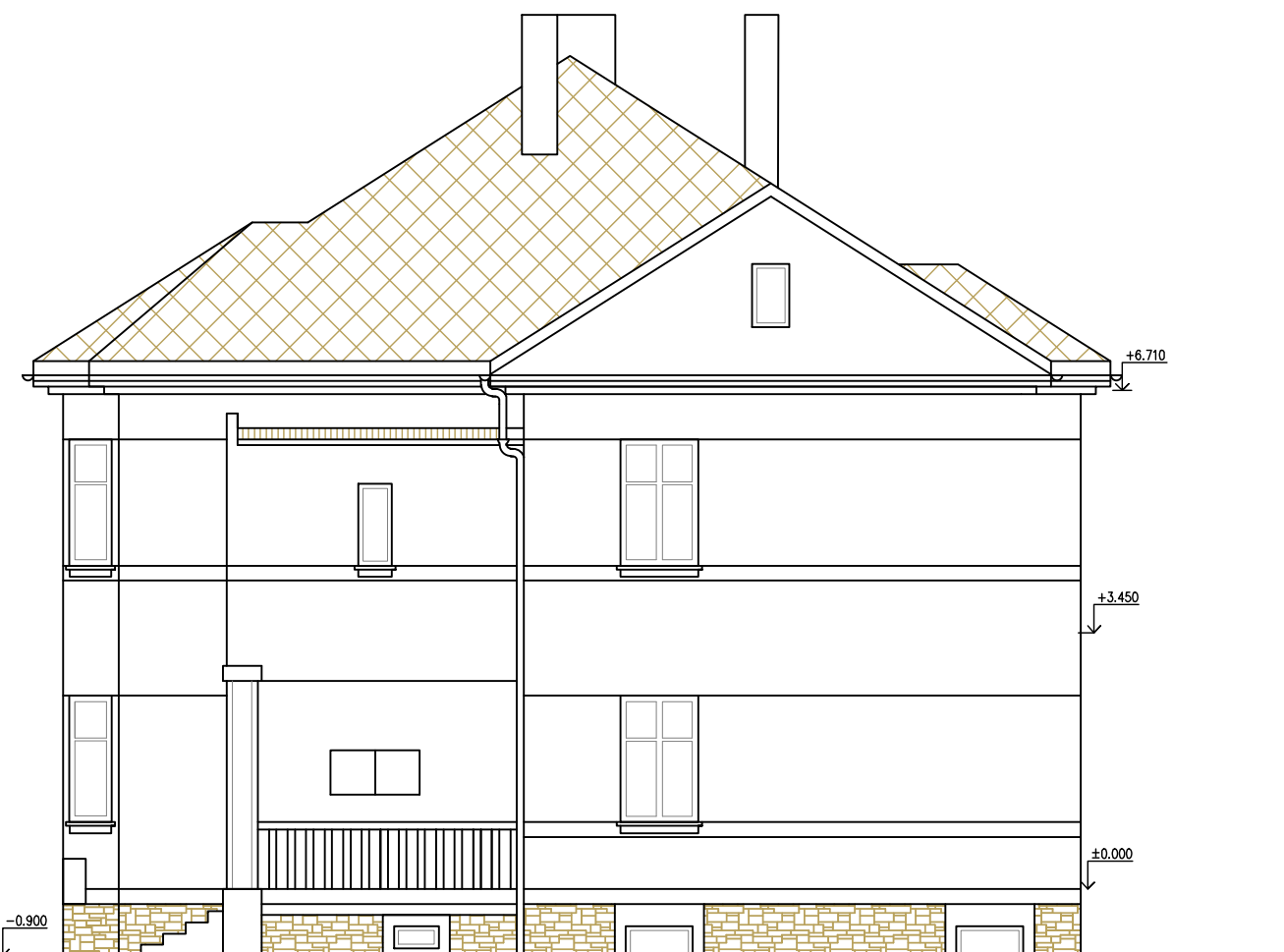
POHLED BOČNÍ SEVEROVÝCHODNÍ