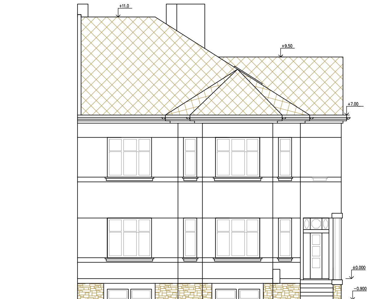
POHLED Z ULICE JHOVÝCHODNÍ