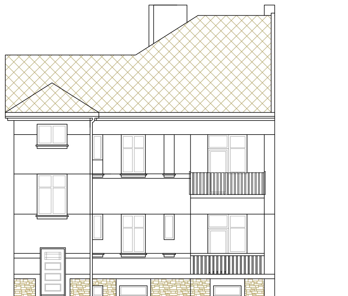
POHLED ZE ZAHRADY SEVEROZÁPADNÍ