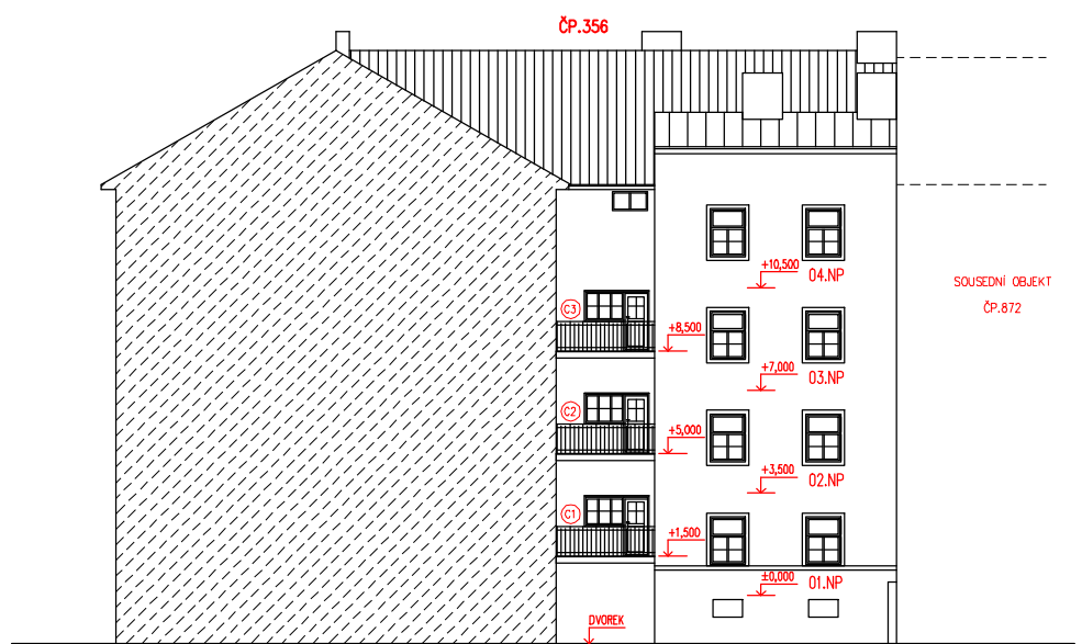
JIHOZÁPADNÍ POHLED NA DVORNÍ ČÁST