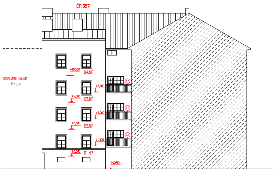
SEVEROVÝCHODNÍ POHLED NA DVORNÍ ČÁST