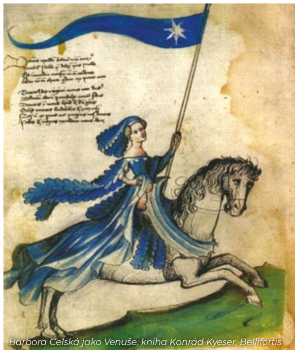
Barbora Celská jako Venuše, kniha Konrád Kyeser, Bellifortis

Barbora Celská zemřela ve svém sídle na Mělníku během morové epidemie v roce 1451. Císařovna, uherská a česká královna byla pohřbena v pražské katedrále sv. Víta.