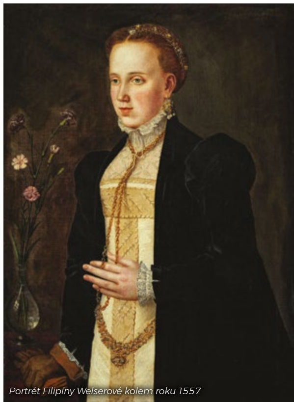
Portrét Filipíny Welserové kolem roku 1557

Nerovné manželství bylo uznáno pouhé čtyři roky před smrtí Filipíny, kdy jej posvětil papež. Tou dobou žili manželé na zámku Ambras u Innsbrucku. Ferdinandova právoplatně uznaná manželka zemřela s pohledem na milovaného muže se slovy: „Vidím, co mě těší! Navzdory četným protivenstvím bylo manželství – dcery obchodníka a potomka císaře – jedno z nejšťastnějších v historii habsburského rodu.“