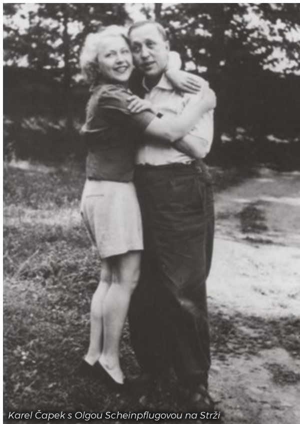
Karel Čapek s Olgou Scheinpflugovou na Strži

V okamžiku jejich setkání dělil Karel Čapek své srdce mezi exotickou Věru Hružovou a drobnější