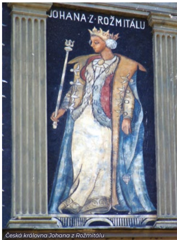
Česká královna Johana z Rožmitálu

Až do posledních let svého života žil Jiří svým velkým snem. Počítal s tím, že založí „poděbradskou dynastii“ a pokusí se ji u českých stavů prosadit. K tomu mu ale scházel syn, narozený v době, kdy už byl Jiří králem. A přitom měl Jiří tolik dětí – k šestici z prvního manželství mu jich přibylo pět dalších. Velké naděje tak oba vkládali alespoň do svého prvorozeného syna