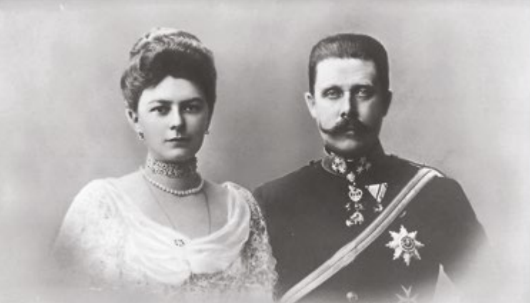
Fotografie na protější straně: Portrét Františka Ferdinanda a Žofie Chotkové Antonín Dvořák s chotí Annou Svatba Karla I. a Zity za účasti císaře Františka Josefa I. Karel Čapek s prezidentem T. G. Masarykem