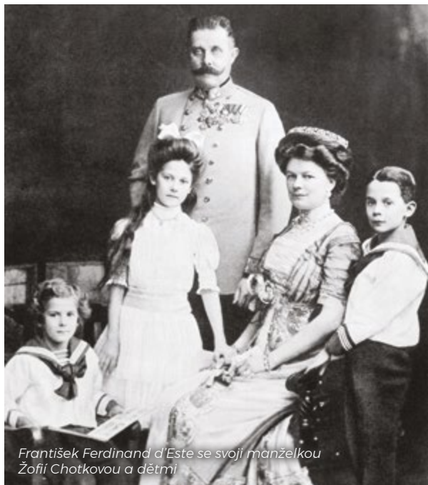
František Ferdinand d'Este se svojí manželkou Žofií Chotkovou a dětmi

Na přelomu 19. a 20. století bylo uzavření sňatku právem jen pro „vyvolené“. Právě proto životní příběh české šlechtičny Žofie Chotkové (1868-1914) a následníka rakousko-uherského trůnu Františka Ferdinanda d'Este (1863-1914) překonal veškerá tehdejší tabu.