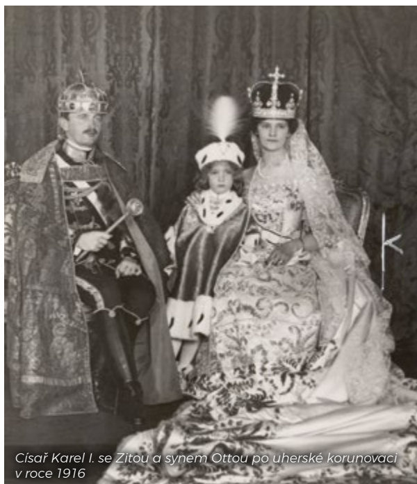
Císař Karel I. se Zitou a synem Ottou po uherské korunovaci v roce 1916

O několik let později se ve Františkových Lázních setkal s atraktivní Zitou. Štíhlá mladá žena, s vlasy vyčesanými do drdolu, byla pro svůj půvab srovnávána s císařovnou Alžbětou. Karel, druhý na postu následníka rakousko-uherského trůnu, byl nucen do sňatku a Zita měla vhodný královský původ. Ovšem její city se rozvíjely následující dva roky, než ji Karel požádal o ruku. Na zasnubní fotografii připsala Zita své