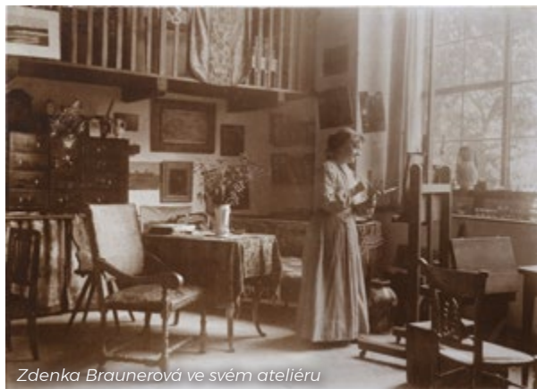
Zdenka Braunerová ve svém ateliéru

První žena 19. století, která odmítla roli ženy pouze jako dobré matky a manželky, a namísto toho se pustila do kariéry výtvarné umělkyně. Ač okouzila řadu zajímavých mužů a prožila několik lásek, tu pravou nikdy nenašla.