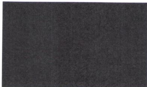
tajemník Hodnoticí komise