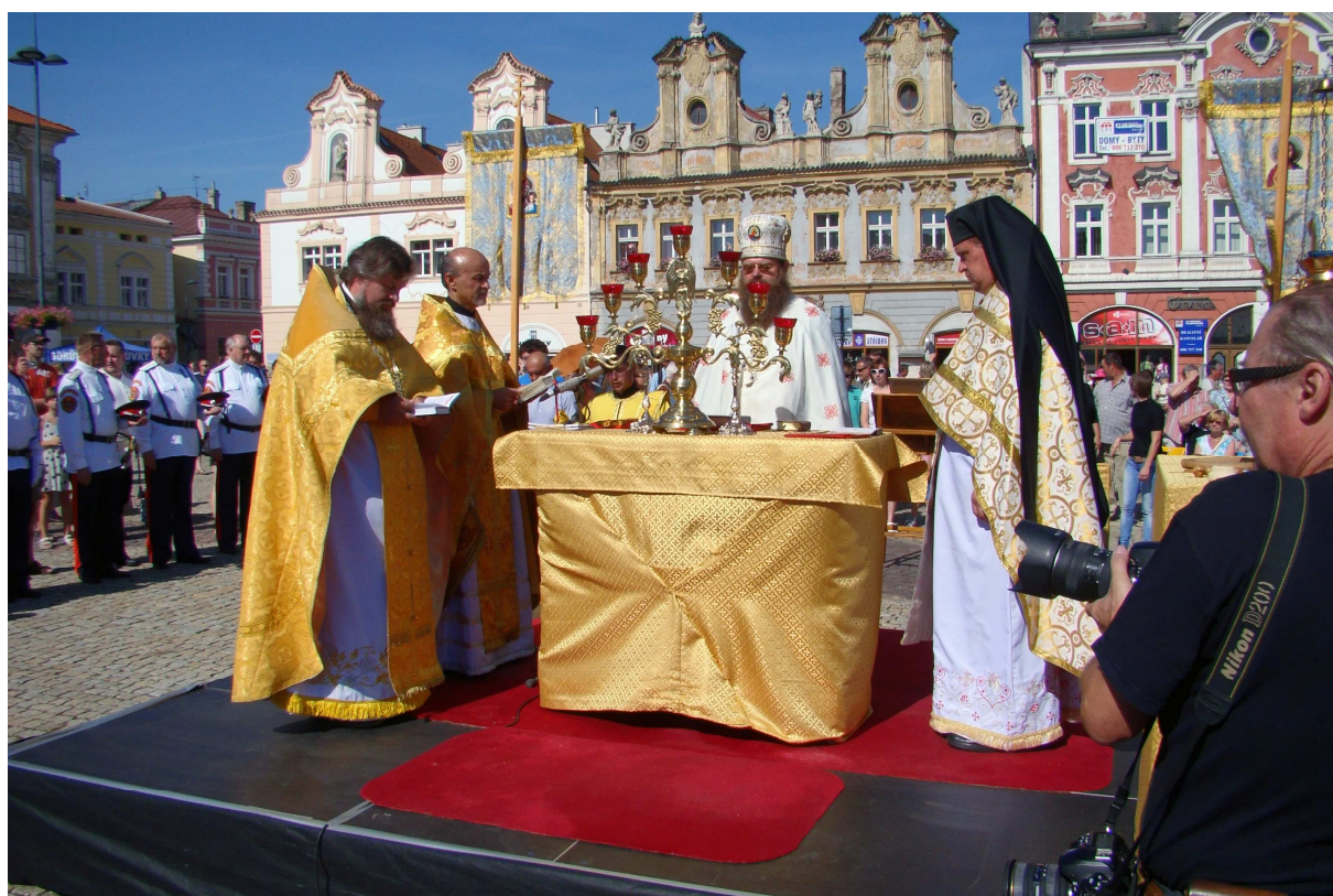
Pravoslavná mše na Karlově náměstí