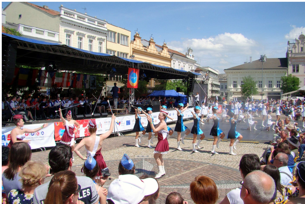
Nedělní monstrkoncert na Karlově náměstí

Rok 2013 se v Kolíně nesl v duchu jubilejního 50. ročníku festivalu dechových hudeb Kmochův Kolín. Svým rozsahem letošní ročník konaný ve dnech 13. až 16. června výjimečnost tohoto jubilea bezpochyby naplňoval.