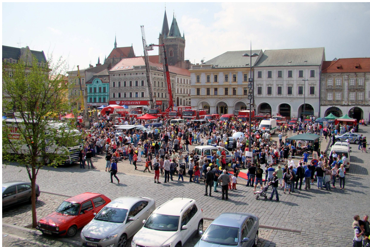
Zaplněné Karlovo náměstí

Na 17. ročníku této tradiční akce konané vždy v den státního svátku 8. května byly letos k vidění nejen složky integrovaného záchranného systému, ale úspěch měl třeba i BESIP s otočným simulátorem nárazu. Dokonce bylo možné vyzkoušet si, jak to vypadá ve škodovce, která letí vývrtkou vzduchem. Mnoho zájemců přilákalo i stanoviště OHES, kde bylo možné nechat si změřit množství tělesného tuku. Lidé se zajímali též o ukázky Městské policie Kolín, která předváděla zneškodnění útočnicka ozbrojeného nožem či pistolí. Děti už tradičně lákají hasičská auta i všemožná policejní výbava. U většiny těchto atrakcí se tvořila fronta. Dalo se také soutěžit. Rozpočet celé akce včetně propagace, občerstvení a cestovného se pohyboval mezi 250 až 300 tisíci korun. Představitelé města, policistů a hasičů položili květiny u pomníku v Sokolské ulici. Na letošním pietním aktu zahrála Městská hudba Františka Kmocha, která se pak přesunula s přihlížejícími na náměstí, kde se prezentovaly taneční skupiny Domů dětí a mládeže Kolín či místních škol. Odpoledne krátce zapršelo, ale program pokračoval na Kmochově ostrově ukázkami hasičů,