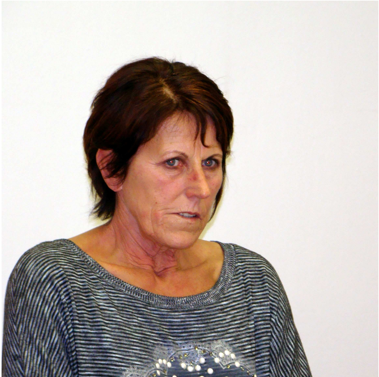
Jarmila Kratochvílová v kolínské knihovně

Ve čtvrtek 14. listopadu se v kolínské knihovně uskutečnila zajímavá beseda s držitelkou nejstaršího atletického světového rekordu Jarmilou Kratochvílovou. O besedu byl obrovský zájem a diváci se téměř nevešli do výstavní síně městské