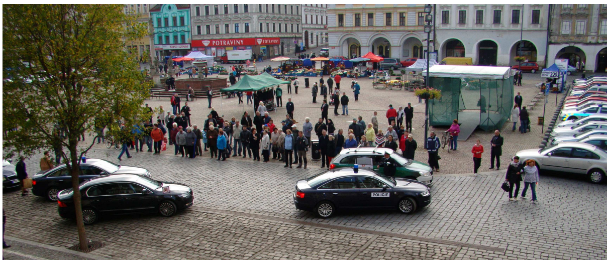
Bezpečnostní opatření provázející návštěvu prezidenta republiky Miloše Zemana v Kolíně