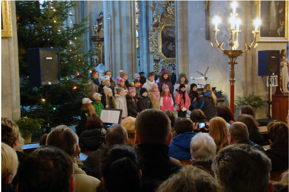
Dětský pěvecký sbor Boni Bambini z Kolína na vánočním koncertu k poctě betlémského světla v chrámu

Čtyři koncerty s adventní či vánoční atmosférou mohli obyvatelé Kolína navštívit ve dnech 20. až 26. prosince. První se konal v pátek 20. prosince v Městském divadle v 10 hodin dopoledne a zazpíval na něm Pěvecký sbor Gymnázia Kolín. Pěvecký sbor Continuo se potom představil v evangelické modlitebně o den později v 17 hodin a zazpíval i méně známá díla, jako např. Whitbournovu mši Son of God. Cestovní kancelář Monatour uvedla v chrámu sv. Bartoloměje adventní koncert se svařeným vínem a klobáskami na poslední adventní neděli 22. prosince. od 18 hodin večer. Kromě muzikálové hvězdy Radima Schwaba na něm letos zazpívala také sólistka Státní opery Praha a Národního divadla Anda-Louise Bogza. Město Kolín pak pořádalo taktéž v chrámu sv. Bartoloměje vánoční koncert k poctě betlémského