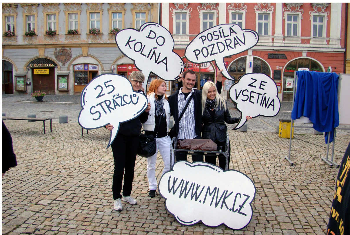
Zdravice knihovníků ze Vsetína

V pátek 20. září se Kolín stal centrem knihovnického dění v Česku. Hostil totiž Knihovnický happening, který byl zahájen ve 14:30 hod. na Karlově náměstí. Touto akcí vyvrcholily oslavy 140 let založení kolínské knihovny. Happeningu se zúčastnilo více než 130 účastníků z knihoven z celé republiky. Nejpočetnější výprava přicestovala z Ostravy. Dále se přihlásili knihovníci ze Vsetína, Písku, Mladé Boleslavi, Slaného, Jeseníku, Valašského Meziříčí, Prahy, Příbrami, Berouna, Jičína, Častolovic, Dobruška a také z Chotěboře, Čáslavi, Kutné Hory nebo Zásduk. Ti se utkali v pěti disciplínách, které se přímo týkaly jejich povolání a byly pojaty humornou formou. V disciplínách bojovalo 6 soutěžních družstev – Písek, Ostrava, Vsetín, Mladá Boleslav, Slaný a Střední Čechy. Pro veřejnost byla připravena soutěž Mluvme hezky česky. Přímo na náměstí si každý zájemce mohl vyzvednout soutěžní lístek, vyplnil odpovědi a byl zařazen do slosování o ceny. Na závěr akce proběhlo slosování a předání cen. Večerní program se pak přesunul do Městského společenského domu, kde byl pro zúčastněné připraven mimo jiné raut. Happening