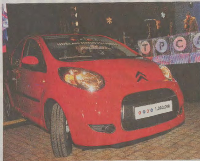
TPCA SLAVILA. Červený citroën s výrobním číslem 1 000 000 sjel z linky po 3 letech a 9 měsících.

Pokud TPCA příští rok zvýší výrobu, bude potřebovat další lidi. V posledních měsících se jejich počet zvýšil o padesát, dalších padesát chce automobilka přijmout příští rok. Firma by ráda nabrala místní. Agenturní za-